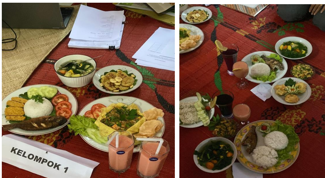
Gambar 3. Olahan menu sehat ibu hamil dan balita dari bahan lokal