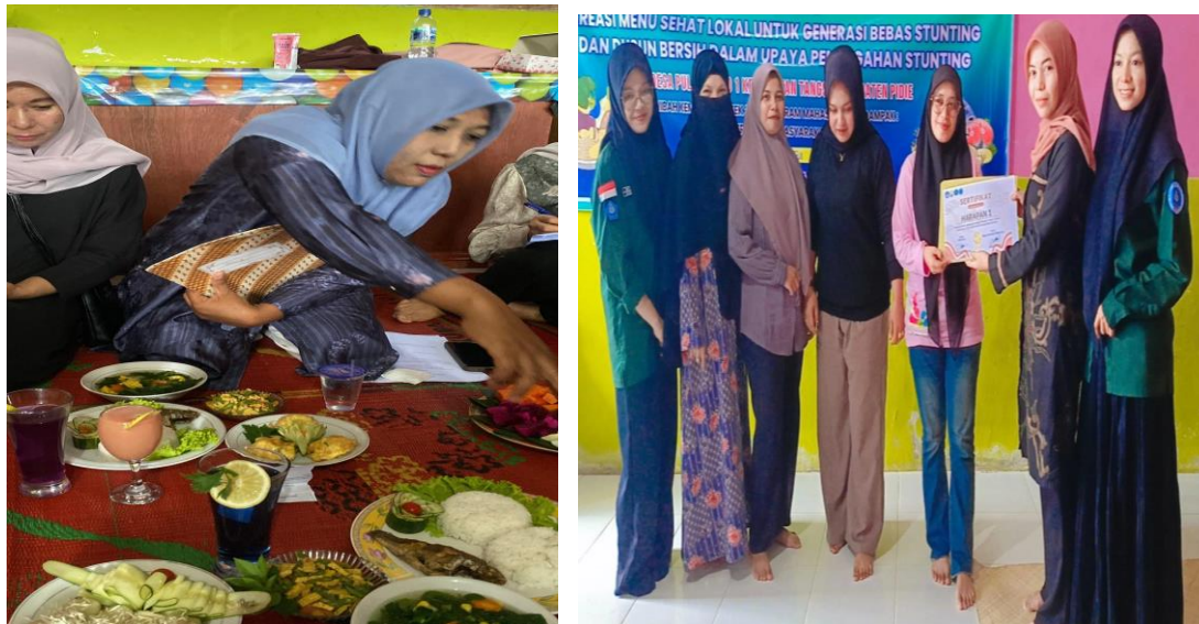
Gambar 4. Evaluasi Menu sehat dari ahli gizi dan pemberian sertifikat