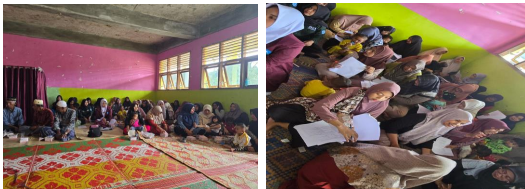
Gambar 1. Ibu Hamil, Nifas Dan Ibu Balita